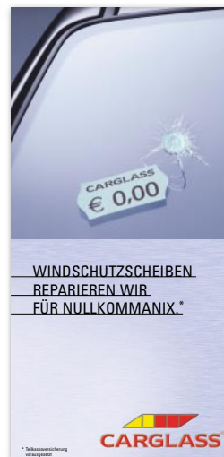
Flyer „Kostenlose Reparatur“