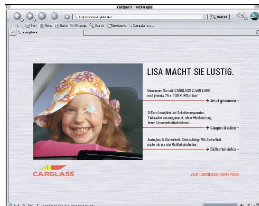
Aktionsseite vorgeschaltet vor www.carglass.de