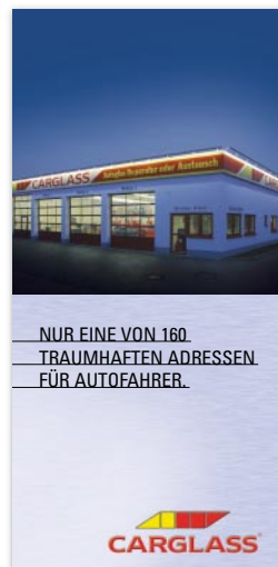
Flyer „Service- center-Übersicht“

Kunden finden alle notwendigen Informationen über das Unternehmen, das Leistungsspektrum und die Niederlassungen in kundenorientiert gestalteten Flyern. DIN A1 Poster in den Service Centern greifen die Kernbotschaften der Kommunikation auf und verstärken vor Ort die Wirkung der Anzeigen- und Funkkampagne.